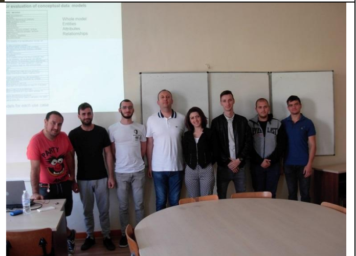
Slike 4. Fotografije sa predavanja