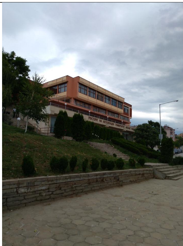
Slika 2. Zgrada Rektorata Univerziteta „Neofit Rilski“